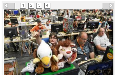
Los participantes en el Euskal Encounter han personalizado su sitio frente al ordenador en los 35.000 metros cuadrados del pabellón 5 del BEC.

En la cita de la modernidad y las nuevas tecnologías también hay cabida para el pasado. 'Retroeuskal', un rincón dedicado a los ordenadores y consolas antiguas, atesora un 'Spectrum' de 8 bits creado en el 82 y reconvertido para conectarse a Internet. No son los únicos que juegan a experimentar. La asociación Euskobyte Elkarte lanzará hoy un globo estratosférico de dos metros de diámetro desde el BEC (11.00 horas). El objetivo es que alcance los 30.000 metros de altura antes de iniciar su descenso y aterrizaje previsto en Haro (La Rioja), para recuperarlo y obtener las imágenes que haya registrado.