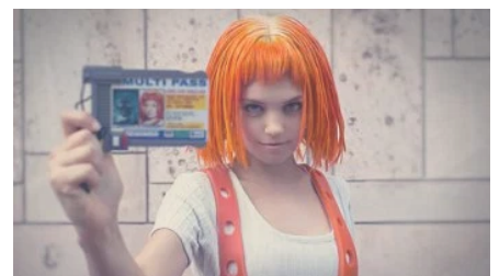
25 de mayo: Día del Orgullo Friki En "Geek txoko"