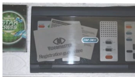
La consola más peculiar que he visto en mi vida: Star Chess (y su