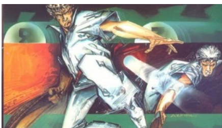
LOAD "": Historia del videojuego vasco (1985-2009)