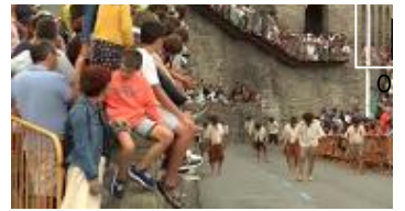
▶ Getaria recibe a Sebastián I

© DIARIO EL CORREO, S.A. Sociedad Unipersonal. C/ Pintor Losada 7 48004 Bilbao