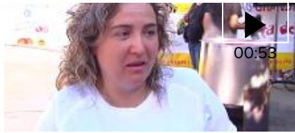
▶ O Carballiño cocina la tapa de pulpo más grande del mundo