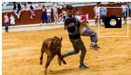
📷 Tiernos recortes de aprendiz