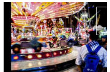
📷 Las barracas se instalan cada año en Mendizabala