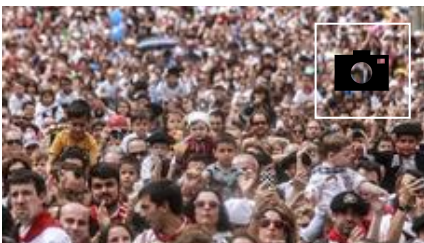
📷 Los más pequeños festejan su día grande en Vitoria con Celedón txiki y Edurne