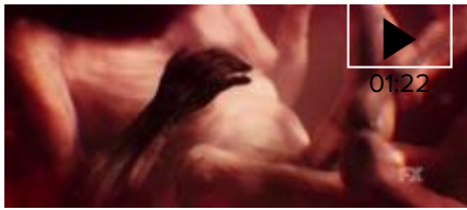
▶ Llega el Anticristo en el primer tráiler de American Horror Story: Apocalypse