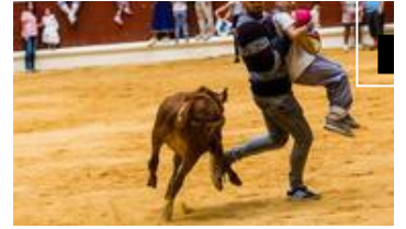
Tiernos recortes de aprendi