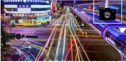
Así es Hyperloop, el tren futurista que llegará a España