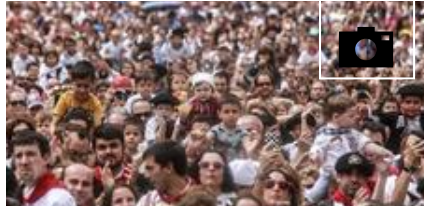
Los más pequeños festejan su día grande en Vitoria con Celedón txiki y Edurne