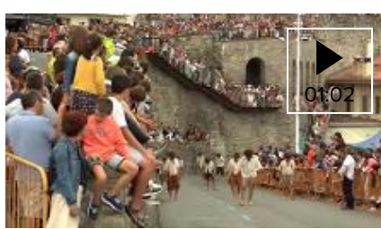
Getaria recibe a Sebastián Elcano