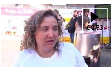
O Carballiño cocina la tapa de pulpo más grande del mundo