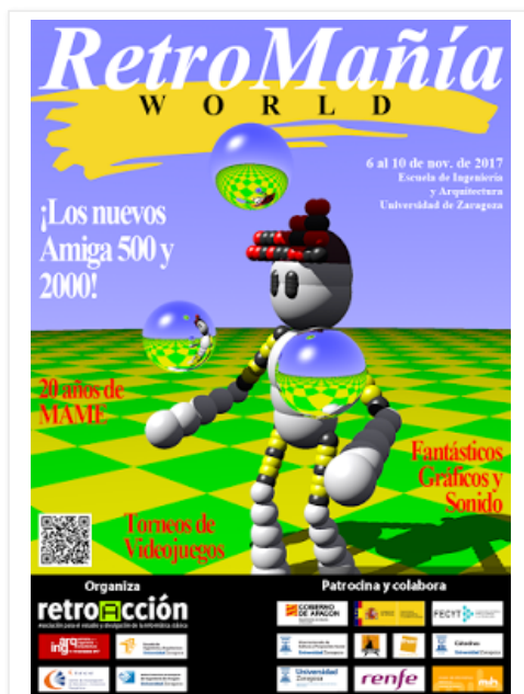
El cartel es un homenaje a la portada de la revista Amiga World

Desde el próximo 6 de noviembre todos los visitantes a Retromañía 2017 , que tendrá lugar en la Escuela de Ingeniería y Arquitectura (EINA) de la Universidad de Zaragoza , podrán disfrutar de un homenaje póstumo al ilustrador Alfonso Azpiri , que tristemente nos dejó el pasado 18 de agosto. Los chicos de Retroacción han preparado una exposición en su honor, que incluye una representación de sus 25 mejores trabajos y cuatro bocetos. La exposición estará disponible en la segunda planta del edificio Ada Byron de la misma escuela.